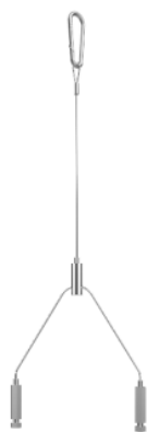
Zawieszanie z drutu stalowego