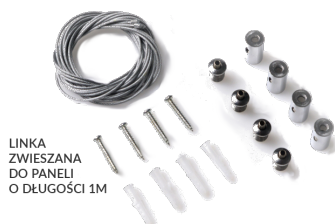
LINKA ZWIESZANA DO PANELI O DŁUGOŚCI 1M