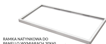
RAMKA NATYNKOWA DO PANELI O WYMIARACH 30X60