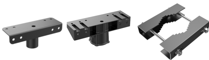
GL-NIMBO-AD-08-02 (dia.42mm) GL-NIMBO-AD-08-03 (dia.76mm)