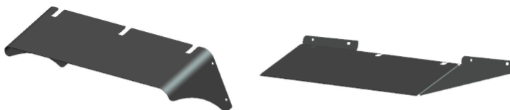
Przyłbice do kontroli światła