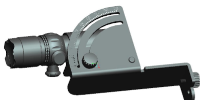
Urządzenie do regulacji pozycji